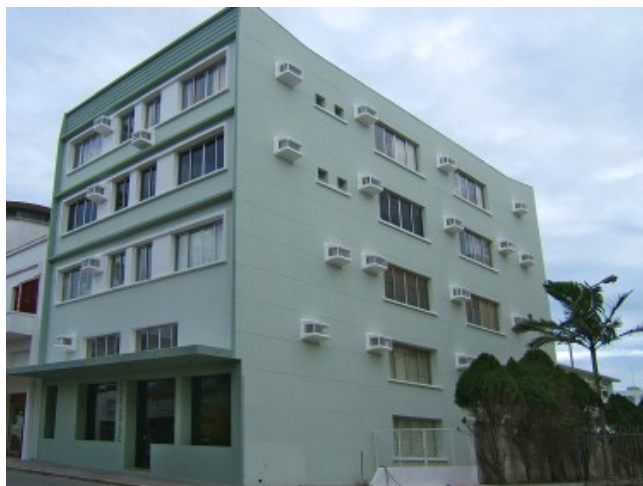
■ Prédio da Sede da COHAB/SC